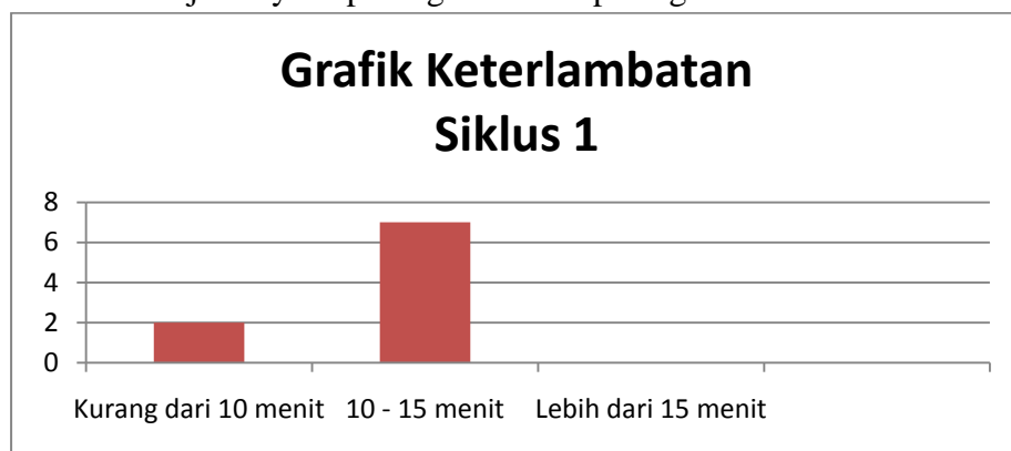
Grafik 1. Grafik keterlambatan pada siklus I

Untuk lebih jelasnya dapat digambarkan pada grafik dibawah ini :