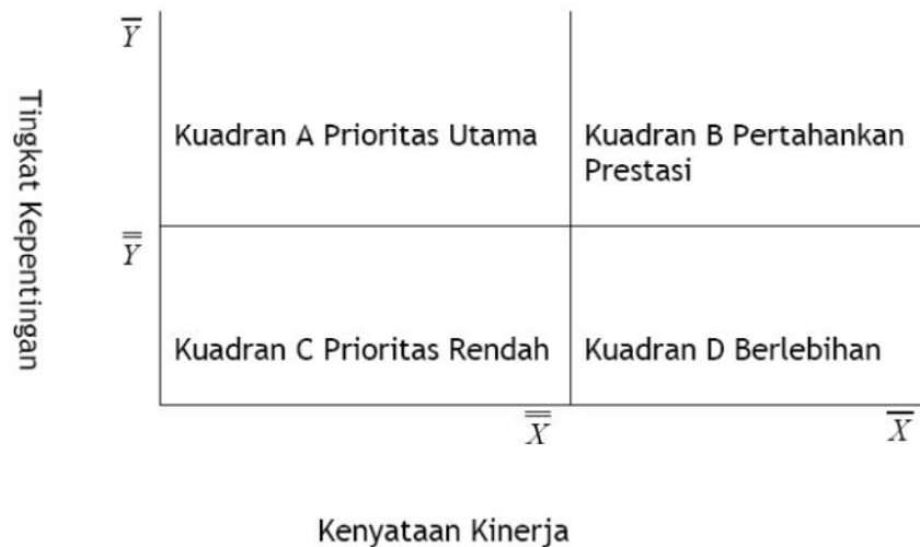
Gambar 2. I-P Analysis

Analisis data yang digunakan untuk mengukur Kepuasan Pelanggan PDAM adalah Importance-Performance Analysis (I-P Analysis) atau dikenal juga dengan istilah Gap Analysis (Analisis Kesenjangan) . I-P Analysis digunakan untuk mengukur seberapa besar kesenjangan antara tingkat kepentingan (harapan pelanggan) dengan kenyataan (kualitas layanan PDAM). Analisis kesenjangan untuk mengetahui urutan prioritas aspek-aspek layanan yang menentukan kepuasan pelanggan menggunakan Diagram Kartesius. Diagram Kartesius merupakan suatu diagram yang dibagi menjadi empat kuadran, yang dibatasi oleh dua buah garis horisontal dan vertikal pada titik koordinat X dan Y, dimana X adalah rata-rata skor tingkat kenyataan (kinerja layanan), sedangkan Y adalah rata-rata skor tingkat kepentingan (harapan pelanggan).