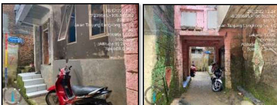
Gambar 5. Bentuk Adaptasi Infrastruktur dengan Peninggian Fondasi Bangunan dan Membangun Lantai Dua

Berdasarkan informasi yang didapatkan oleh informan kunci dan informan pendukung dijelaskan bahwa sebagai bentuk adaptasi infrastruktur dan bangunan yang masyarakat miliki telah dilakukan berbagai langkah yang digunakan untuk mengurangi dampak dari bencana banjir terhadap infrastruktur tempat tinggal mereka. Langkah tersebut meliputi langkah minor yaitu perbaikan beberapa bahan seperti penggantian asbes dan plafon, penggantian lampu, pengecatan kembali dinding bangunan yang terdapat bekas banjir, penggantian bagian kayu pada rumah yang sudah lapuk. Langkah mayor dengan melakukan peningkatan rumah menjadi dua lantai atau menaikkan fondasi rumah menjadi lebih tinggi agar dapat digunakan sebagai tempat penyimpanan barang-barang penting dan keluarga mengungsi.