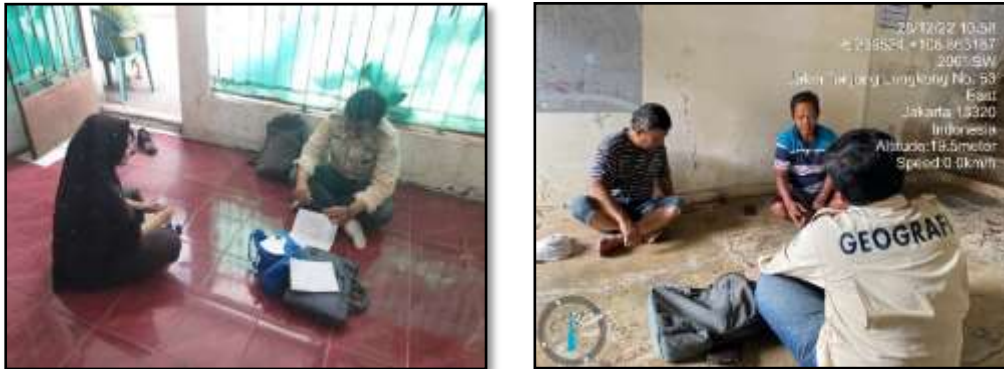
Gambar 3. Dokumentasi Kegiatan Wawancara Dengan Informan Terkait Adaptasi Sosial pada Masyarakat Kelurahan Bidara Cina