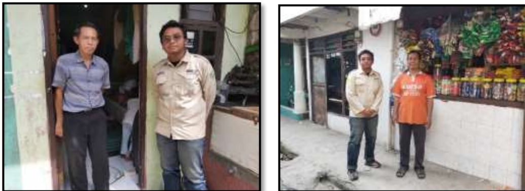
Gambar 2. Hasil Kegiatan Wawancara dengan Informan terkait adaptasi ekonomi yang bekerja sebagai Pekerja Harian (kiri) dan Toko Kelontong (kanan)