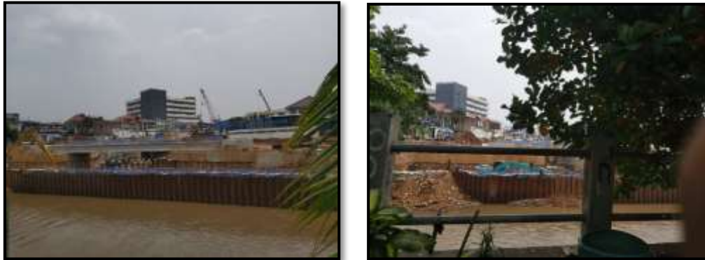
Gambar 6. Pembangunan Sodetan Ci Liwung menuju Banjir Kanal Timur (BKT)

Selain dengan meninggikan fondasi bangunan dan membuat rumah menjadi dua lantai, adaptasi bukan hanya dilakukan oleh masyarakat, namun pemerintah melakukan upaya lain dalam adalah dengan pembangunan sodetan dengan tujuan untuk memecah arus Ci Liwung. Bentuk adaptasi infrastruktur dan bangunan dalam menghadapi bencana banjir di Kelurahan Bidara Cina selain dilakukan oleh Masyarakat sendiri, adaptasi tersebut juga di dukung oleh pemerintah terkait melalui Pembangunan sodetan Ci Liwung dalam mengurangi dampak dan intensitas terjadinya bencana banjir.