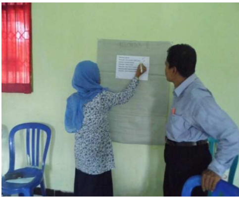
Gambar 2. Guru antusias mengikuti pelatihan PTK

Kegiatan pelatihan penelitian tidakkan kelas ini menarik minat dari peserta pelatihan. Hal itu bisa dilihat dari angket kuisioner yang memperoleh tingkat minat mengikuti kegiatan pelatihan 85% menyatakan berminat ketika mengikuti pelatihan ini. Selain itu juga diperoleh data bahwa 87% mengatakan antusias ketika pelatihan ini dilaksanakan. Segingga dari data minat dan antusias bisa pelatihan ini menarik untuk dilakukan terutama pada madrasah ibtidaiyah.