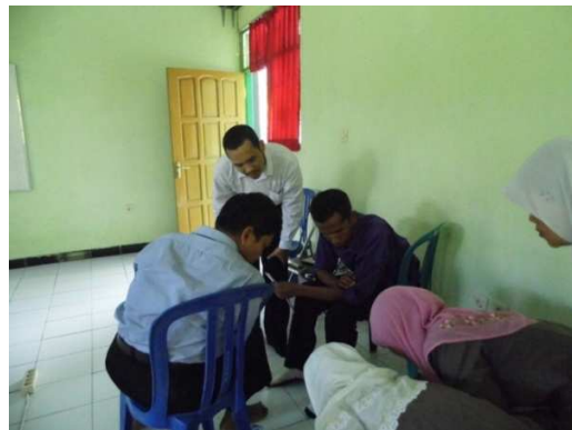
Gambar 3. Pendampingan saat berkelompok

gai wadah untuk sekolah update pengetahuan terbaru yang berkaitan dengan madrasah. Konsep ini diharapkan sebagai wahana kerjasama yang berkelanjutan, sehingga standarisasi Guru bisa terlaksana dengan dukungan dan kerjasama antar instansi.