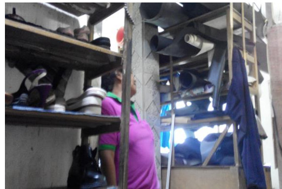
Gambar 3. Produk sepatu dan sandal yang dipajang dengan cara ditumpuk seadanya pada rak kayu yang menempel di dinding.

untuk memajang produk unggulan sandal dan sepatu kulit. Etalase yang digunakan untuk memajang produk hasil kerajinan sandal dan sepatu kulit yang disediakan oleh pengrajin ditempat hanyalah berupa rak sepatu/sandal sederhana yang terbuat dari kayu. Hal ini patut disayangkan karena mengurangi nilai estetika dan daya tarik produk. Dengan menggunakan etalase yang sangat sederhana dan tidak menarik, produk yang dipajang juga menjadi kurang menarik.