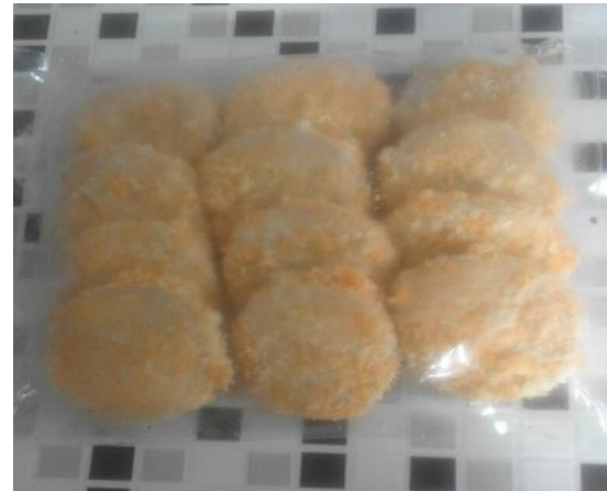
Gambar 11. Nugget olahan lele hasil pelatihan

Secara umum proses transfer pengetahuan dan teknologi tentang budidaya Lele dengan kolam bongkar pasang tidak ada hambatan yang berarti. Hal ini disebabkan karena adanya komunikasi yang intensif antara mitra kelompok Peternak Lele Tradisional dengan pengabdian.