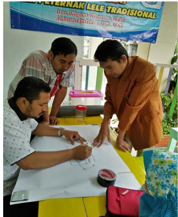
Gambar 5. Desain kolam budidaya

Setelah mitra kelompok petani lele tradisional mendesain sendiri kolam yang akan dibuat, maka kegiatan selanjutnya adalah demonstrasi dan plotting pembuatan kolam budidaya yang disesuaikan dengan area yang dimiliki masing-masing mitra, seperti Gambar 6-8.