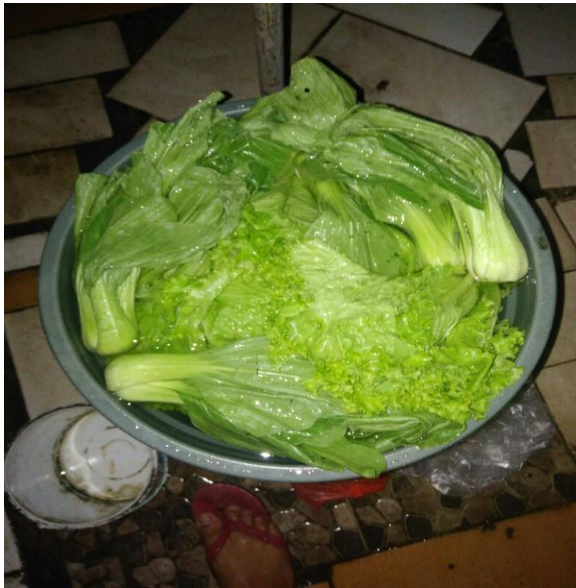
Gambar 9. Hasil panen sayur