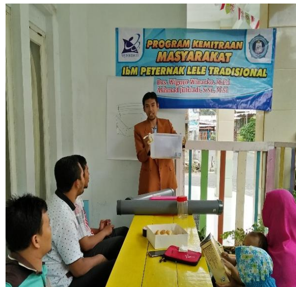
Gambar 3. Pelatihan budidaya lele

Kegiatan pelatihan seperti Gambar 3, dilakukan dengan menyampaikan materi tentang proses pembuatan kolam dan perangkat akuaponik, pemilihan bibit lele yang baik, kualitas air, dan pemeliharaan kesehatan lele.