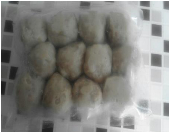
Gambar 10. Bakso olahan lele hasil pelatihan

kegiatan ini dilakukan dengan cara melakukan pelatihan produksi olahan Lele, antara lain: Nugget lele dan bakso lele.