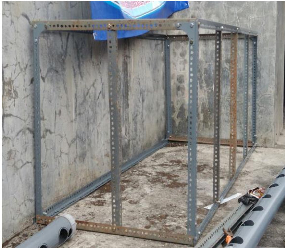
Gambar 7. Rangka kolam