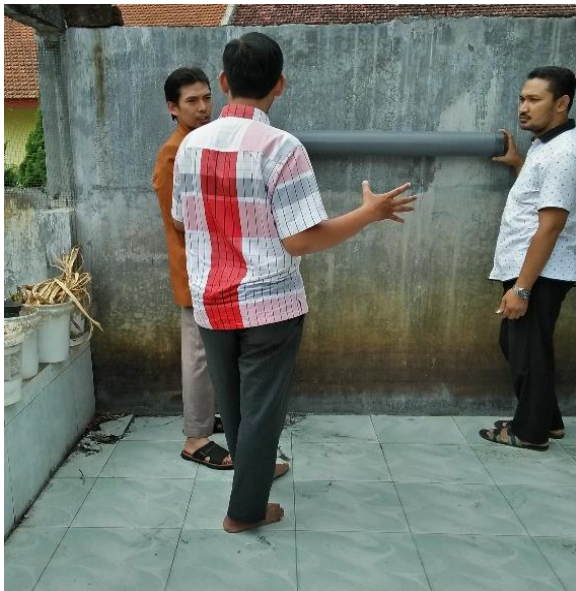
Gambar 4. Peninjauan lokasi kolam lele

terlebih dahulu, seperti Gambar 4. Peninjauan awal lokasi pembuatan kolam untuk mendapatkan gambaran nyata desain kolam yang akan dibuat yang disesuaikan dengan kondisi tempat yang ada. Setelah pengukuran dan peninjauan tempat kolam yang direncanakan, maka peserta mulai mendesain kolam secara bersama dengan menggambar bentukkolam yang sesuai dengan area yang tersedia, seperti Gambar 5.