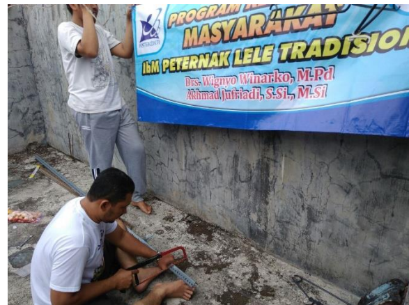
Gambar 6. Pembuatan rangka kolam

Setelah mitra kelompok petani lele tradisional mendesain sendiri kolam yang akan dibuat, maka kegiatan selanjutnya adalah demonstrasi dan plotting pembuatan kolam budidaya yang disesuaikan dengan area yang dimiliki masing-masing mitra, seperti Gambar 6-8.