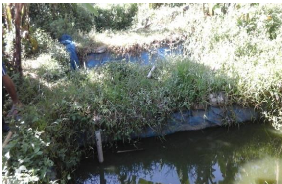
Gambar 1. Kondisi Kolam Peternak Lele Tradisional

Mitra merupakan kelompok Peternak Lele Tradisional yang belum produktif secara ekonomis tetapi berhasrat kuat menjadi wirausahawan, dan masih membutuhkan sentuhan kegiatan iptek untuk meningkatkan kualitas dan kuantitas hasil budidaya lele. Dari hasil monitoring dan wawancara dengan dua kelompok mitra tersebut dapat diketahui beberapa permasalahan mitra sebagai berikut: 1) Pengetahuan dan ketrampilan mitra dalam budidaya lele sangat rendah terutama budidaya dengan sistem akuaponik tetapi mempunyai motivasi yang kuat dalam berwirausaha, 2) hasil panen sangat rendah, karena tingginya tingkat kematian dan bahkan salah satu kolam yang ada sudah tidak difungsikan karena gagal panen sedangkan kolam lainnya sudah kurang perawatan. Pakan yang diberikan terhadap ikan lele bahkan menggunakan bangkai ayam yang dibakar terlebih dahulu. Hasil ikan lele hanya digunakan untuk pemenuhan kebutuhan sehari-hari. 3) Kolam menggunakan kolam terpal tanah dengan kondisi yang tidak terawat. 4) tidak adanya manajemen dan administrasi pembukuan kelompok.