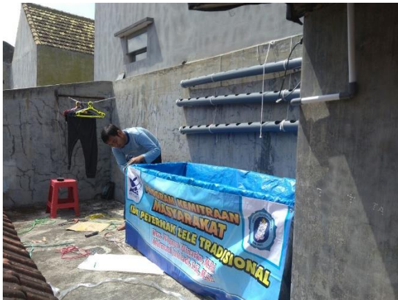
Gambar 8. Kolam budidaya lele

Dari kegiatan tersebut, mitra telah mampu meningkatkan pemahamannya terhadap budidaya dan pengolahan Lele serta mampu menghasilkan pendapatan tambahan.