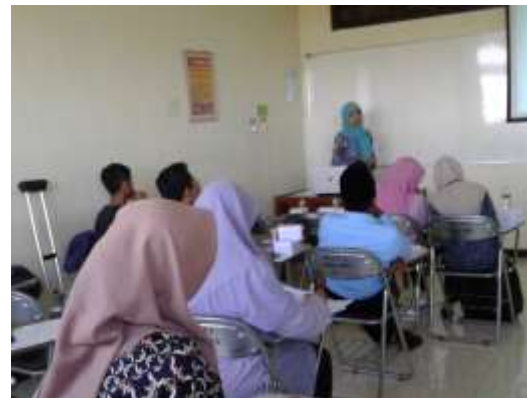
Gambar 3. Kegiatan pembekalan

Faktor penghambat merupakan hal-hal yang mengganggu kelengkapan dan kelancaran pelaksanaan program kegiatan diantaranya: 1) Ada peserta yang belum memiliki pengalaman dalam berwirausaha. 2) Kegiatan pelatihan yang dilaksanakan bertepatan dengan kegiatan kemahasiswaan yang lain. 3) Bagi alumni yang sudah bekerja (mengajar) waktunya kerja bertepatan dengan kegiatan pelatihan dan workshop