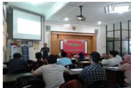
Gambar 4. Kegiatan pelatihan dan workshop