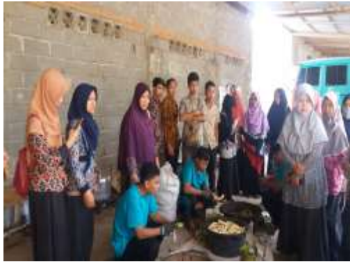
Gambar 5. Kegiatan observasi ke UMKM olahan keripik Anis Jaya