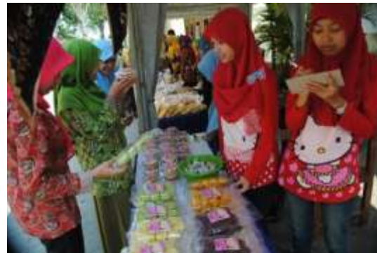
Gambar 5. Pameran kewirausahaan produk PPK

Pembinaan pemasaran yang dilakukan tidak hanya pemasaran secara konvensional ( offline ), tetapi juga melalui online. Pembinaan dalam pembuatan dan pemasaran via facebook dan instagram dilakukan untuk meningkatkan peluang pasar. Selain itu, PPK memfasilitasi tenant untuk memasarkan produknya melalui kegiatan pameran baik diselenggarakan oleh UNISDA maupun di luar UNISDA, seperti UNISDA Expo, Bazar wisuda, pameran produk unggulan kewirausahaan mahasiswa.