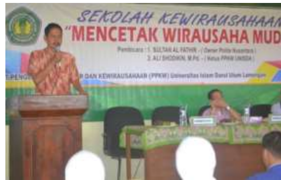
Gambar 2. Sekolah Kewirausahaan

pentingnya berwirausaha dari pengalaman pribadi owner CV. Polita Nusantara dan penyusunan rencana bisnis oleh Ketua Pusat Pengembangan Karir dan Kewirausahaan UNISDA. Kegiatan ini diikuti oleh 198 peserta dari mahasiswa dan alumni. Terlihat antusiasme peserta dalam mengikuti kegiatan, baik saat penyampaian materi, diskusi, tanya jawab hingga pembuatan rencana bisnis.