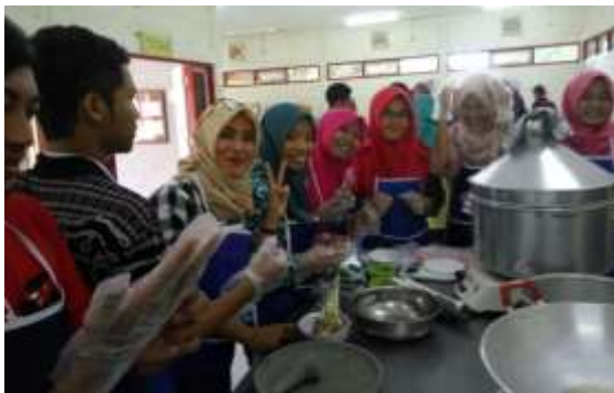
Gambar 4. Pelatihan pembuatan produk

Untuk membangun keterampilan produksi, tenant juga diberikan praktek pembuatan produk. Dalam kegiatan ini, karena beragam produk tenant yang ada, pelaksanaan workshop terbatas pada produk makanan. Kegiatan praktik lainnya yang dilakukan adalah kunjungan industri UMKM dan magang di industri.