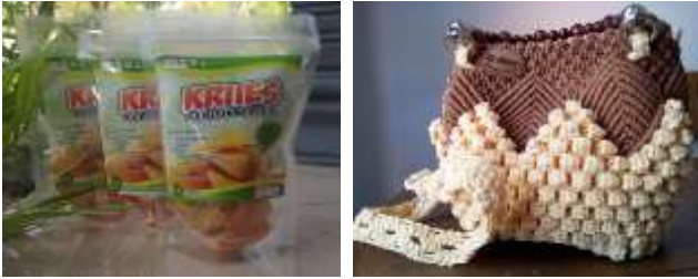
Gambar 3. Beberapa produk hasil PPK

Untuk membangun keterampilan produksi, tenant juga diberikan praktek pembuatan produk. Dalam kegiatan ini, karena beragam produk tenant yang ada, pelaksanaan workshop terbatas pada produk makanan. Kegiatan praktik lainnya yang dilakukan adalah kunjungan industri UMKM dan magang di industri.