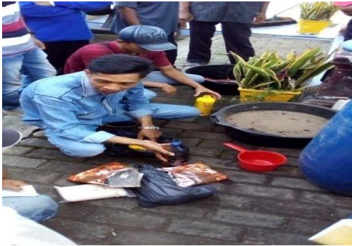
Gambar 3. Peyiapan bahan-bahan untuk pembuatan silase

Dokumentasi tentang pelaksanaan demo plotting teknologi pakan ternak disajikan pada Gambar 3, 4, 5, dan 6.