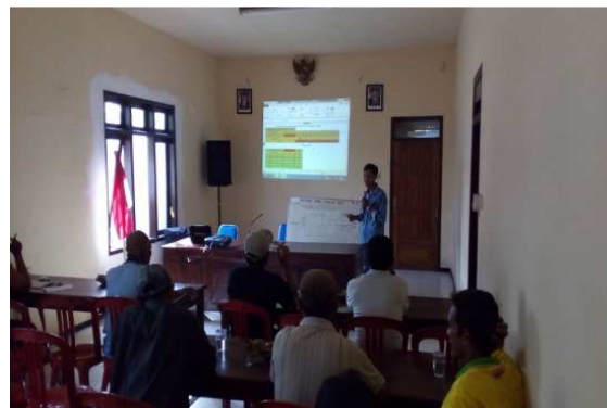
Gambar 2. Dokumentasi kegiatan demo plotting formulasi pakan kambing

Dua puluh peternak kambing di desa Kromengan, Kecamatan Kromengan, Kabupaten Malang mengikuti kegiatan penyuluhan dan demo plotting tentang formulasi pakan kambing. Persentase khalayak sasaran yang memahami tentang formulasi pakan kambing sebesar 90%. Dokumentasi kegiatan demo plotting formulasi pakan kambing disajikan pada Gambar 2.