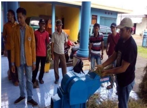
Gambar 4. Kegiatan chooper jerami sebagai bahan pembuatan silase