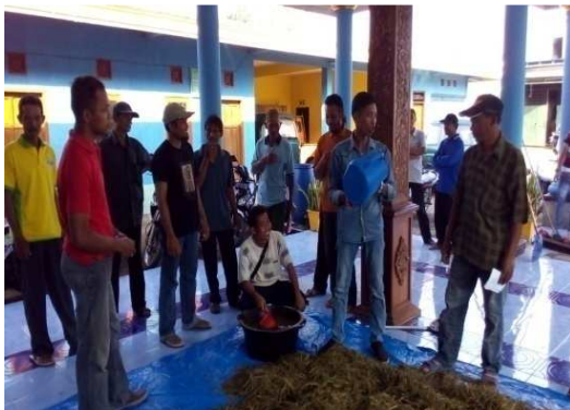
Gambar 5. Kegiatan pencampuran jerami dengan molasses dan EM 4