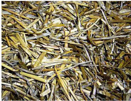
Gambar 7. Penampilan produk akhir silase

yaitu 5. Penampilan produk akhir silase disajikan pada Gambar 7.