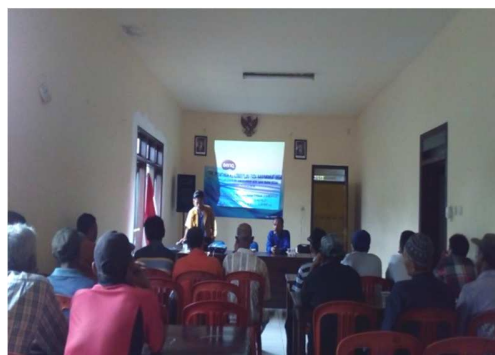
Gambar 1. Dokumentasi kegiatan penyuluhan

Dua puluh peternak kambing di desa Kromengan, Kecamatan Kromengan, Kabupaten Malang mengikuti kegiatan penyuluhan tentang pengenalan jenis-jenis bahan pakan yang berpotensi sebagai pakan ternak kambing. Persentase khalayak sasaran yang memahami tentang jenis-jenis bahan pakan yang berpotensi sebagai pakan ternak kambing sebesar 90%. Dokumentasi kegiatan penyuluhan disajikan pada Gambar 1.