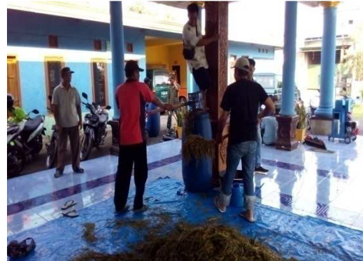
Gambar 6. Kegiatan pencampuran jerami dengan molasses dan EM 4

Keberhasilan silase dapat diketahui dari beberapa parameter, yaitu: Evaluasi kualitas silase dapat dilaksanakan dengan dua metode, yaitu: