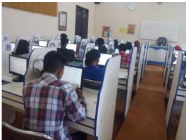
Gambar 1. Suasana pelatihan

Sesi dilanjutkan dengan join grup kelas. Disini tim memberikan kode grup dala hal ini tim telah membuat kelas vocabulary, peserta dapat bergabung dalam kelas ini. Dalam kegiatan ini semua peserta harus bertegur sapa dengan mengucap salam kepada sesama peserta yang lain.