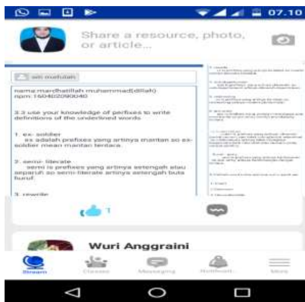
Gambar 2. Hasil simulasi join group

Setelah bergabung dalam group peserta dapat membuka fitur-fitur yang ada dan mencoba mengerjakan simulasi tugas yang diberikan. Disini pemateri memberikan soal sederhana dan peserta menjawab pertanyaan melalui fitur yang telah disediakan.