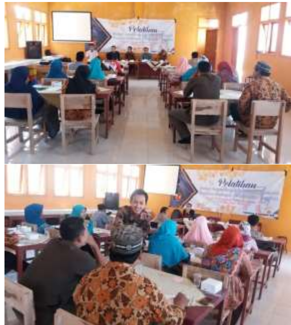
Gambar 2. Kegiatan Pelaksanaan Pengabdian pada Masyarakat

fasilitas perpustakaan sekolah, dan strategi advokasi. Berikut adalah dokumentasi pelaksanaan pelatihan (Gambar 2).