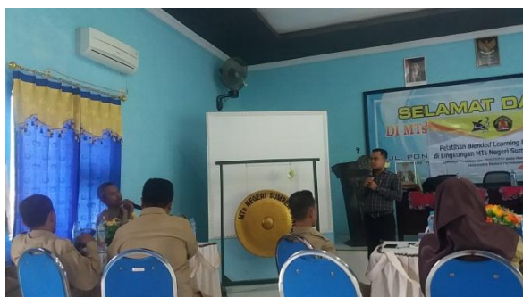
Gambar 1. Kegiatan Pelaksanaan Pengabdian Masyarakat

aplikasi dalam blended learning berupa aplikasi Quiz Creator dan Edmodo. Pelaksanaan pelatihan dimulai dengan pemaparan tentang blended learning oleh narasumber Moh.Zayyadi, M.Pd. dosen Universitas Madura dan dilanjutkan dengan pemaparan aplikasi Quiz Creator dan Edmodo oleh narasumber Durroh Halim dari mahasiswa prodi pendidikan matematika Universitas Madura. Pada saat pemaparan tentang penggunaan aplikasi, peserta langsung dipandu untuk praktek langsung dengan menggunakan laptop masing-masing peserta. Gambar berikut menunjukkan pelaksanaan pelatihan.