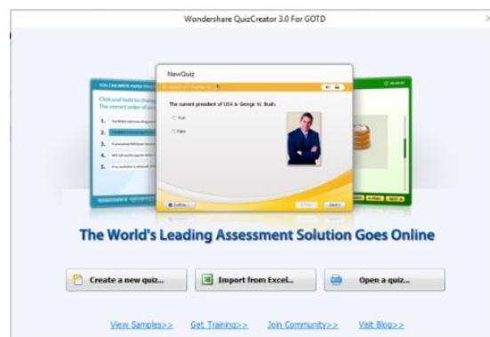
Gambar 3. Tampilan Quiz Creator

Pada akhir pelatihan para peserta mengisi angket kembali untuk mengetahui respon mereka setelah diberikan penjelasan tentang blended learning dan aplikasi Quiz dan Edmodo. Berdasarkan hasil angket kami mendapatkan hasil sebagaimana tabel berikut.