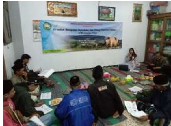
Gambar 1. Pelaksanaan Kegiatan Penyuluhan

Tim pengabdian memberikan pemahaman kepada para peternak tentang pentingnya melakukan recording dengan praktek cara pencatatan parameter reproduksi menggunakan kalender reproduksi meliputi; identitas sapi, data reproduksi yang meliputi kapan birahi, tanggal perkawinan, tanggal kebuntingan, tanggal kelahiran, IB pertama, IB kedua, dst, serta Non Return Rate (NRR), dan juga mengenai kesehatan reproduksi meliputi penanganan penyakit dan pemberian vitamin, sehingga dapat meminimalisir terjadinya gangguan reproduksi pada ternak yang dipelihara.