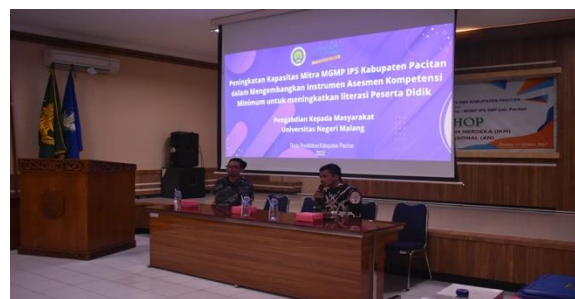
Gambar 4. Penyusunan ATP dan Modul Ajar

Penyampaian penyusunan alur tujuan pembelajaran didasarkan pada materi yang disusun guru IPS yang merujuk pada kebijakan terkait capaian pembelajaran (ATP). Penyusunan ATP ini akan lebih mudah apabila dilakukan secara berurutan, linier, logis, dan kolaboratif (Ayundasari, 2022). Pada dasarnya ATP ini selaras dengan silabus pembelajaran yang ada di Kurikulum 13, namun pada Kurikulum Sekolah Penggerak ini, guru dikuatkan dalam mendesain pembelajaran yang berkesinambungan.