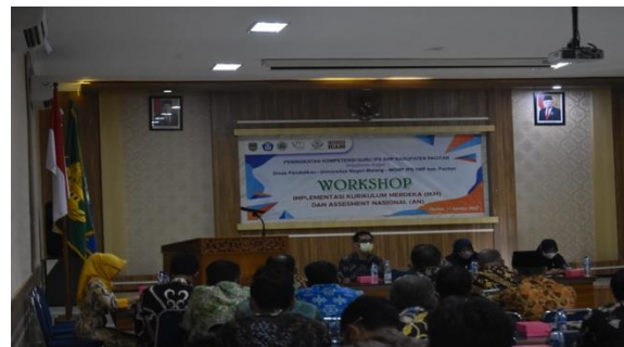
Gambar 3. Kegiatan Program Pengabdian

Kegiatan program pengabdian berupa pendampingan penyusunan instrumen Asesmen Kompetensi Minimum (AKM) bagi MGMP IPS Pacitan yang bertujuan meningkatkan profesionalisme guru, dilakukan melalui dua tahapan. Tahapan ini yakni tahapan pertama , penyampaian materi tentang Asesmen Kompetensi Minimum kepada guru-guru MGMP IPS (Gambar 3).