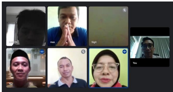
Gambar 2. Kegiatan Koordinasi Pra Kegiatan

Negeri Malang. Namun, sebelum dilakukan pendampingan secara tatap muka langsung, tim pelaksana pengabdian melakukan koordinasi dengan tim mitra MGMP IPS Kabupaten Pacitan secara online (Gambar 2).