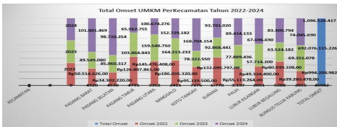
Gambar 1. Grafik Total Omset UMKM Kuliner PerKecamatan di Kota Padang Tahun 2022-2024

Sumber : Dinas Koperasi dan UMKM Kota Padang 2022-2024