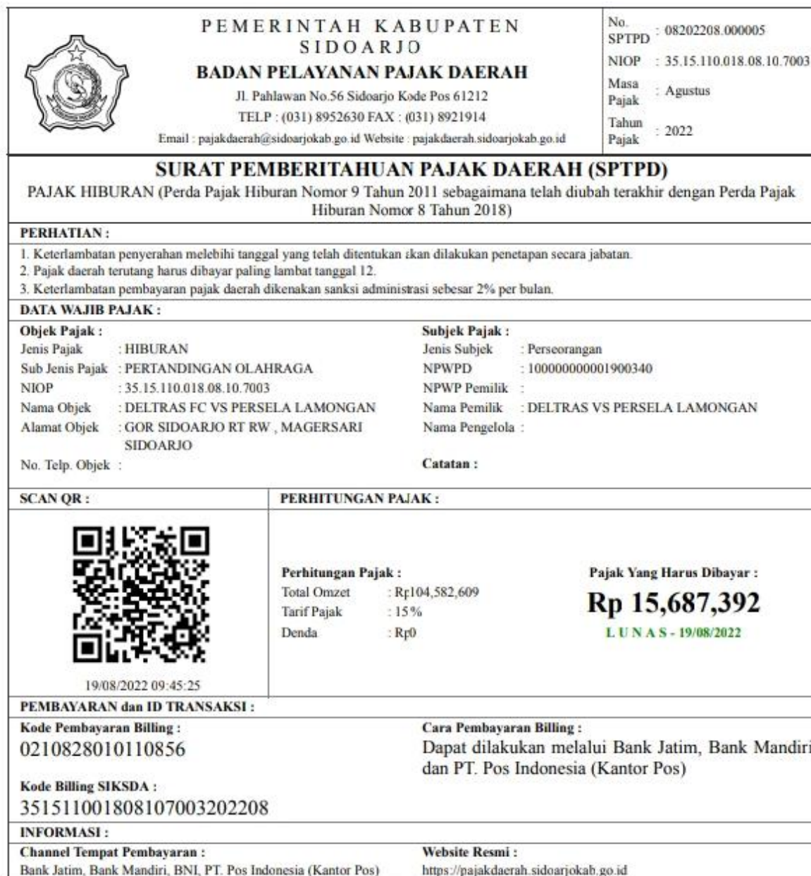
Gambar 1. Bukti Pelunasan Pajak Pertandingan Olahraga Liga 2 "Deltras Vs Persela".