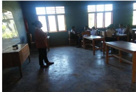
Gambar 1. Menyampaikan Materi Bilangan Bulat

membentuk kelompok dengan anggota kelompoknya berjumlah 4-5 siswa dengan kemampuan yang berbeda-beda, mulai dari kemampuan tinggi, sedang hingga kurang mampu (Swintari, Ali, & Murdiana, 2016).