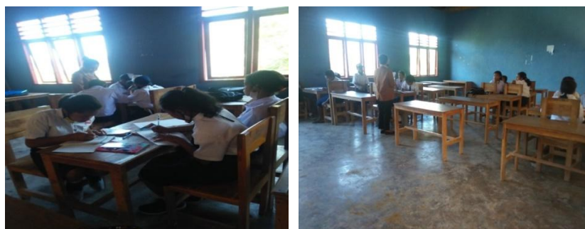
Gambar 3. Menyelesaikan LKS dan Membimbing Kelompok Berpengalaman

Team study monitoring , peneliti mempersilahkan siswa untuk mengerjakan LKS bersama temannya dan mengamati tindakannya, serta membimbing kelompok yang mengalami kesulitan. Selanjutnya peneliti meminta perwakilan tiap kelompok untuk mempresentasikan jawaban yang telah didiskusikan dan kelompok lain menanggapi jawaban siswa.