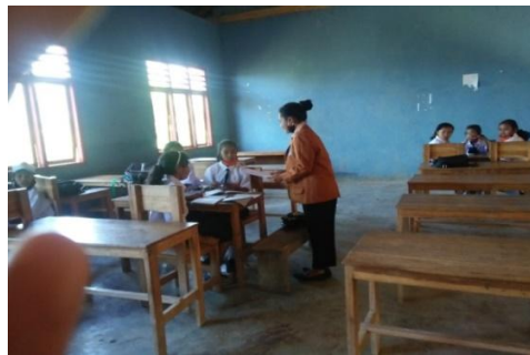
Gambar 2. Memberikan LKS kepada Siswa

Belajar kelompok , peneliti membentuk siswa dalam kelompok agar siswa berinteraksi dengan teman sekelompoknya, sehingga bisa membangun keaktif dalam menyelesaikan LKS (Abimanyu, Mallo, & Hadjar, 2015). Sebanyak enam kelompok dibentuk, kemudian peneliti memberikan LKS kepada siswa, kemudian mengerjakan soal agar siswa lebih memahami tentang bilangan bulat.