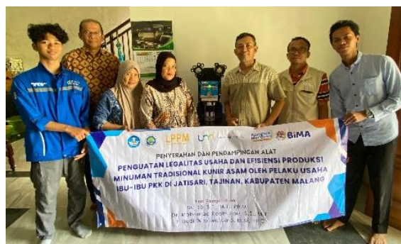
Gambar 4. Foto Bersama Tim Pengabdian Dan Mitra

Kegiatan pengabdian kepada Masyarakat ini berfokus kepada ibu-ibu PKK di Desa Jatisari Kecamatan Tajinan Kabupaten Malang yang dilaksanakan dari bulan maret hingga akhir tahun 2025. Kegiatan ini bertujuan untuk memperkuat legalitas usaha dan efisiensi produksi minuman tradisional kunir asem.