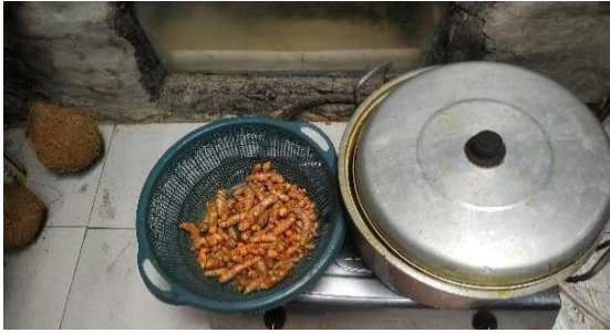
Gambar 2. Proses Produksi Kunir Asem Jatiarum

Kualitas kunir asem sangat dipengaruhi oleh bahan baku, proses pembuatan, dan kebersihan selama produksi (A'yunin et al., 2019). Pada proses pembuatannya meliputi berapa proses tahapan dengan penyortiran kunyit untuk memisahkan bagian bagian kunyit yang memiliki kualitas bagus dan jelek, serta penyortiran ini bertujuan untuk membersihkan kotoran yang menempel pada kunyit dan dilakukan proses pencucian bahan baku lalu di lakukan pemotongan kunyit menjadi potongan kecil-kecil, selanjutnya kunyit masuk proses perebusan dengan menambahkan buah asam dan gula (Megawati et al., 2024). Lalu dilakukan proses penyaringan untuk mengambil potongan kunyit yang di rebus untuk dipisahkan dan air rebusan kunyit di tuangkan pada gelas kecil lalu dilakukan proses pengemasan dan tahapan terakhir gelas didinginkan lalu diberikan label produk dan siap untuk di perjualkan (Jumriati & Sugmawati, 2025).