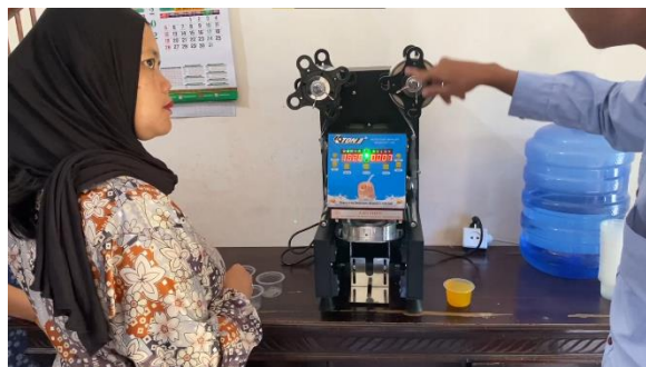
Gambar 5. Pelatihan penggunaan otomatis cup sealer

Penguatan legalitas usaha (NIB, izin edar, BPOM, dan sertifikat halal) merupakan strategi yang efektif dalam meningkatkan kepercayaan konsumen dan akses pasar UMKM, sebagaimana telah dilakukan pada berbagai kelompok PKK di Malang dan daerah lain (Anna Safitri et al., 2023). Lebih lanjut, kegiatan ini bertujuan untuk memperkuat fondasi UMKM guna meningkatkan profitabilitas, memberikan akses terbuka terhadap program program pembinaan dari pemerintah, serta berpeluang untuk dapat menjangkau pasar yang lebih luas. Dengan adanya legalitas usaha menjadi kunci penting untuk mendorong kemandirian ekonomi desa sekaligus memberikan kontribusi UMKM terhadap Perekonomian daerah.