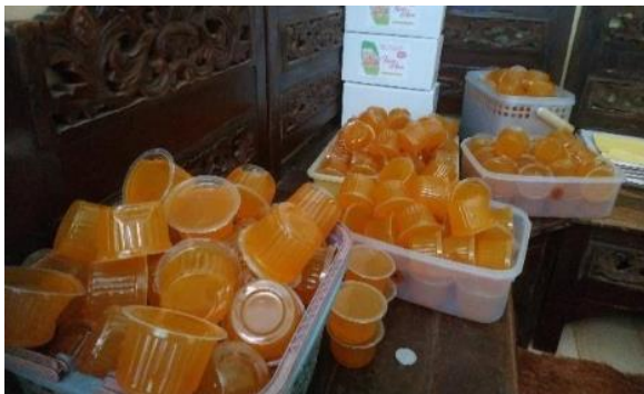
Gambar 1. Produk kunyir Asem Jatiarum

Perkembangan teknologi di era modern sekarang kesadaran masyarakat meningkat dengan maraknya informasi informasi yang sering muncul pada media media sosial. yang mengampanyekan mengenai informasi kesehatan untuk menjaga kesehatan imunitas tubuh munculah tren kepopuleran minuman sehat atau herbal yang kini menjadi bagian penting dari gaya hidup sehari hari (Raidanti, n.d.). Minuman minuman sehat atau herbal pada saat ini dipandang tidak hanya sebagai pelepas dahaga, tetapi sebagai sumber energi, detoksifikasi alami, serta penunjang penampilan dan kebugaran. Kepopuleran minuman sehat atau herbal saat ini bukan sekedar tren sementara, melainkan bagian dari perubahan gaya hidup masyarakat yang lebih peduli mengenai Kesehatan (Lindayani, 2021).