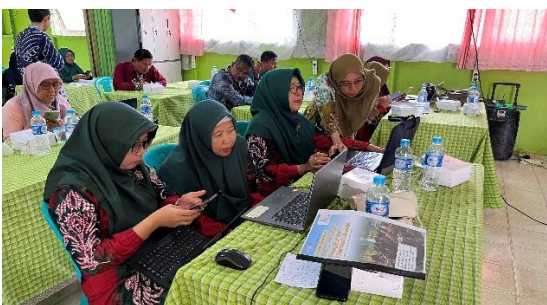
Gambar 2. Pertemuan Kedua

Pertemuan kedua diselenggarakan secara luring di SMAN 1 Alalak. Guru memperoleh materi lanjutan mengenai teknis pengembangan bahan ajar berbasis SCCrT, sekaligus melakukan praktik langsung pembuatan akun dan pengoperasian Liveworksheet . Guru mulai menyusun rancangan bahan ajar dengan mengaitkan topik kimia, seperti larutan asam-basa, hidrolisis garam, atau reaksi redoks, dengan fenomena lingkungan lahan basah. Pada tahap ini terlihat adanya variasi kemampuan guru dalam beradaptasi dengan teknologi, kolaborasi antar sesama peserta membuat proses berjalan efektif.