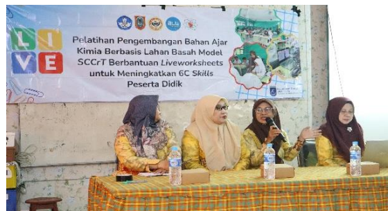
Gambar 3. Pertemuan Ketiga

Pertemuan ketiga menjadi tahap puncak, yaitu presentasi hasil pengembangan bahan ajar yang telah dikembangkan oleh guru-guru. Setiap kelompok memaparkan bahan ajar berbasis lahan basah yang telah dikemas dengan baik. Hasil yang ditunjukkan beragam: sebagian guru mampu mengintegrasikan konsep, konteks, dan teknologi dengan baik, sementara yang lain masih dalam tahap awal. Diskusi dan umpan balik dari narasumber maupun sesama guru memperkaya proses belajar bersama.