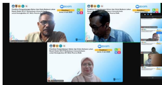
Gambar 1. Pertemuan Pertama Via Zoom Meeting

Pertemuan pertama dilaksanakan secara daring melalui zoom meeting , dengan fokus pada penyampaian materi konseptual mengenai model SCCrT, urgensi integrasi konteks lahan basah, serta pengenalan Liveworksheet sebagai media interaktif. Pada tahap ini guru memperoleh pemahaman teoritis sekaligus kesempatan untuk berdiskusi mengenai tantangan mengaitkan konsep kimia yang abstrak dengan fenomena lokal.