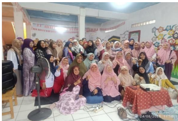
Gambar 4. Seminar Parenting

Seminar bagi para ibu ini dibawakan oleh salah satu pengurus Alppind yang berupaya menghidupkan kembali peran para ibu sebagai madrasah utama bagi anak dalam keluarga. Program ini disambut dengan baik oleh para peserta yang merasa sangat membutuhkan ilmu. Bagi mereka, kegiatan ini perlu dilakukan secara berkelanjutan karena menjadi seorang ibu adalah tugas yang harus terus menerus dibekali ilmu.