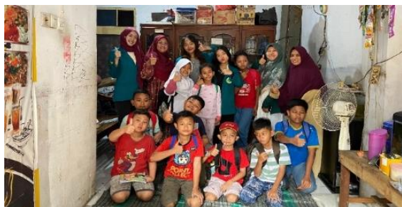
Gambar 2. Mahasiswa UNJ Bersama Anak-anak English Club Buaran

Para mahasiswa hadir dan berinteraksi langsung dengan anak-anak English Club . Mereka mempraktekkan metode pengajaran Bahasa Inggris dengan permainan yang tidak terikat dengan kurikulum yang kaku. Hal ini sesuai dengan target English Club untuk memajukan anak dengan Bahasa Inggris dengan cara yang menyenangkan tanpa terlalu mengacu pada kurikulum yang ketat.