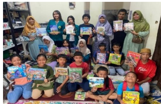
Gambar 3. English Club Reading Corner

Fun Activities , dll. Aktivitas ini dimaksudkan untuk merangsang inovasi dan peningkatan penguasaan kosakata Bahasa Inggris.