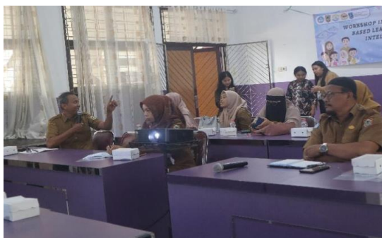
Gambar 3. Diskusi para guru kimia terkait PBL

Para guru Kimia pun terlihat dapat mengkonstruksi masalah apa saja yang aktual dengan kehidupan sehari-hari para siswa, yang dapat digunakan saat pembelajaran. Seperti misalnya terkait permasalahan di lingkungan lahan basah, limbah, dan bahkan reaksi yang terjadi dalam kasus keseharian (Gambar 3). Hal ini sesuai dengan karakteristik pendekatan PBL yang memberikan pengalaman belajar yang membuat peserta didik terdorong untuk mengeksplorasi, menganalisis, dan menemukan solusi terhadap tantangan yang dihadapi karena merasa dekat dengan kesehariannya (Anggraeni et al., 2022).