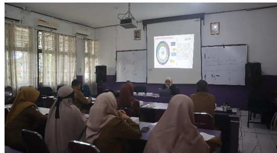
Gambar 2. Pemaparan Terkait Deep Learning di pembelajaran kimia.

Berdasarkan dari post-test kegiatan workshop, guru sudah mampu menggambarkan karakteristik utama pembelajaran mendalam. Terlihat dari guru yang memilih opsi yang menekankan kemampuan siswa untuk menghubungkan konsep, menerapkan pengetahuan, dan menganalisis secara kritis (pernyataan 1). Hal ini sesuai dengan pernyataan Nugraha & Hasanah (2021) yang menyatakan bahwa pemaknaan dari implementasi deep learning ialah meningkatkan kemampuan berpikir tingkat tinggi sehingga menciptakan pengetahuan baru melalui penguasaan materi dan proses penemuan ketika belajar.