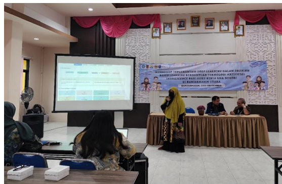
Gambar 4. Persentasi Guru terkait Pengembangan modul berbantuan AI yang dilakukan

Pada prosesnya, tim pengabdian memanfaatkan Canva AI sebagai platform dalam workshop ini. Hal ini dikarenakan Canva dapat diakses secara penuh dengan akun belajar.id yang dimiliki para guru. Canva sendiri memiliki banyak keunggulan dikarenakan memiliki banyak template tampilan menarik untuk dijadikan modul ajar (Tonra et al., 2023). Canva AI sendiri memberi kemudahan dimana para guru kimia hanya perlu memasukkan prompt untuk bisa menghasilkan website tanpa harus belajar coding .