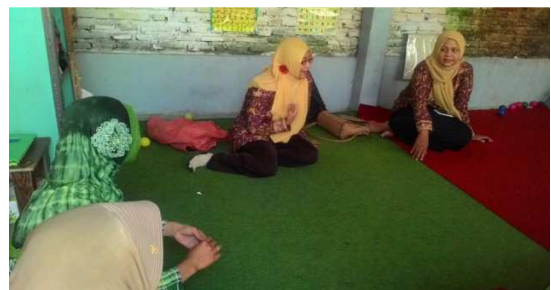
Gambar 3. Focus Grup Discuss

Kegiatan ini diikuti oleh 12 peserta yang merupakan orang tua dari siswa Paud Cahaya Bunda dan 18 peserta yang merupakan orangtua dari siswa Paud Laskar Bintang. Kegiatan ini mendapat tanggapan positif dan baik dari orang tua. Hal ini terlihat dari antusiasme mereka untuk menghadiri acara di setiap pertemuan.