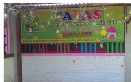
Gambar 1. Paud Laskar Bintang

Paud Cahaya Bunda berlokasi di Jl Tirta Taruno IX RT 01 RW 08 Kecamatan Dau Kabupaten Malang Provinsi Jawa Timur dengan NPSN 69755840. Paud ini memiliki 5 orang guru dan 20 siswa. Adapun Paud Laskar Bintang berlokasi di Jl. Tirta Utomo Landungsari Malang. Paud Laskar Bintang ini memiliki 18 siswa dengan 5 orang guru.