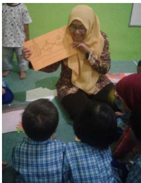
Gambar 4. Alat Peraga Manipulatif

Kegiatan Pengenalan Alat Peraga Kepada Siswa Paud ini diselenggarakan pada tanggal 20 Mei, 22 Juli, dan 7 Agustus 2016 bertempat di Paud Cahaya Bunda dan Laskar Bintang. Kegiatan ini diikuti oleh 18 peserta dari Paud Cahaya Bunda dan 17 peserta dari Paud Laskar Bintang. Kegiatan diawali dengan permainan sederhana dengan tujuan mengenalkan bilangan dan bangun datar sederhana kepada siswa Paud. Alat peraga yang digunakan adalah media manipulatif berbahan dasar kertas buffalo.