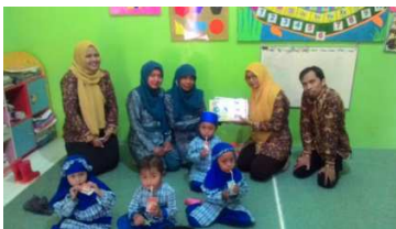
Gambar 5. Diskusi Dengan Guru

Kegiatan pengabdian ini diakhiri dengan diskusi dengan guru untuk sebagai bahan evaluasi kegiatan.