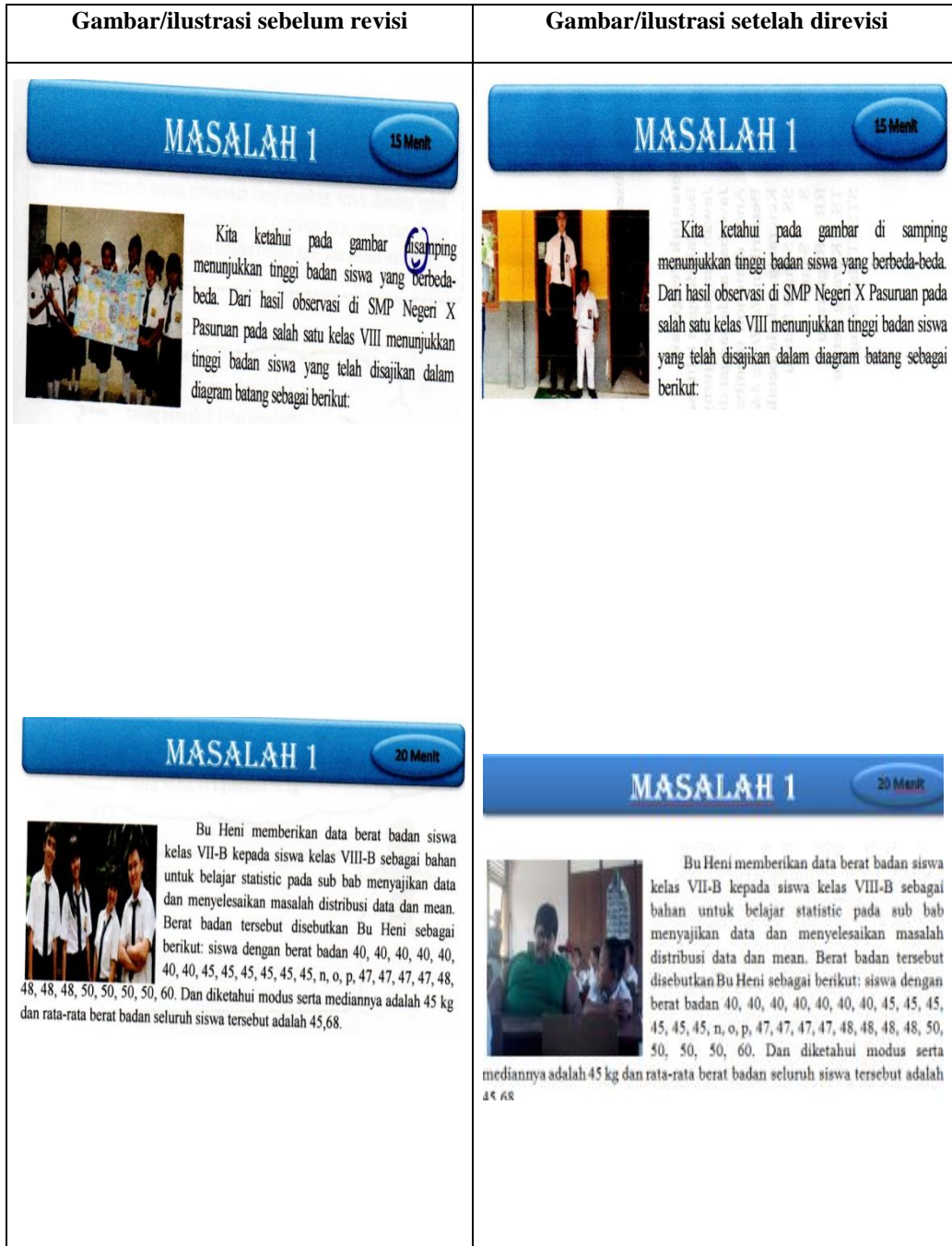
Gambar 4. LKS yang telah direvisi atas saran dari validator